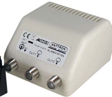
Alimentation : A005